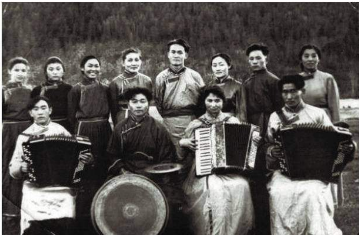
Оркестр при РДК