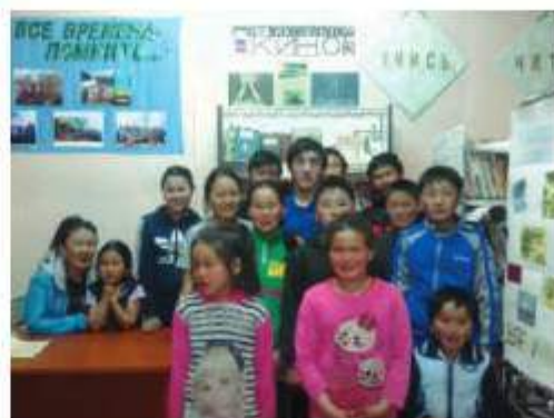
Тематический урок, посвященный Году российского кино