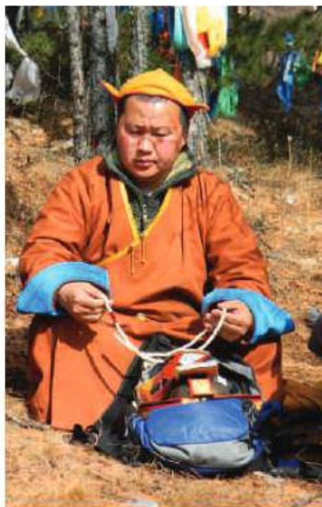
Баяр лама настоятель Окинского да- цана «Лама- жабдойлин»