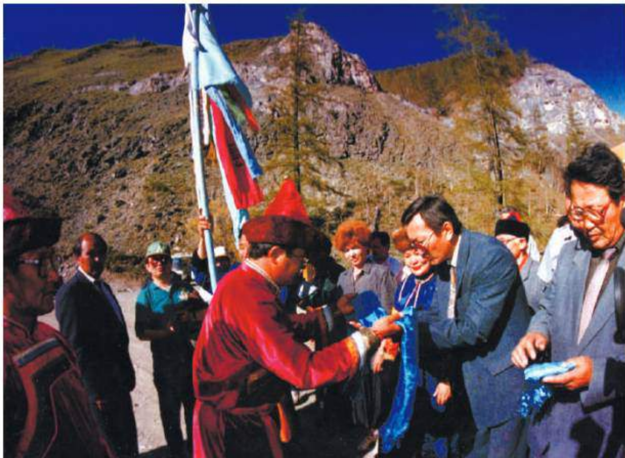
Встреча гостей «Гэсэриады», 1995 г.