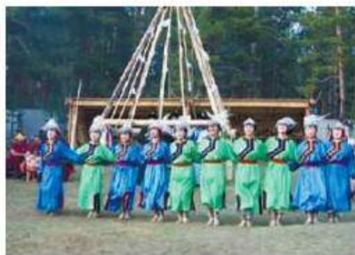
Презентация Сойотского комплекса, 2009 г.