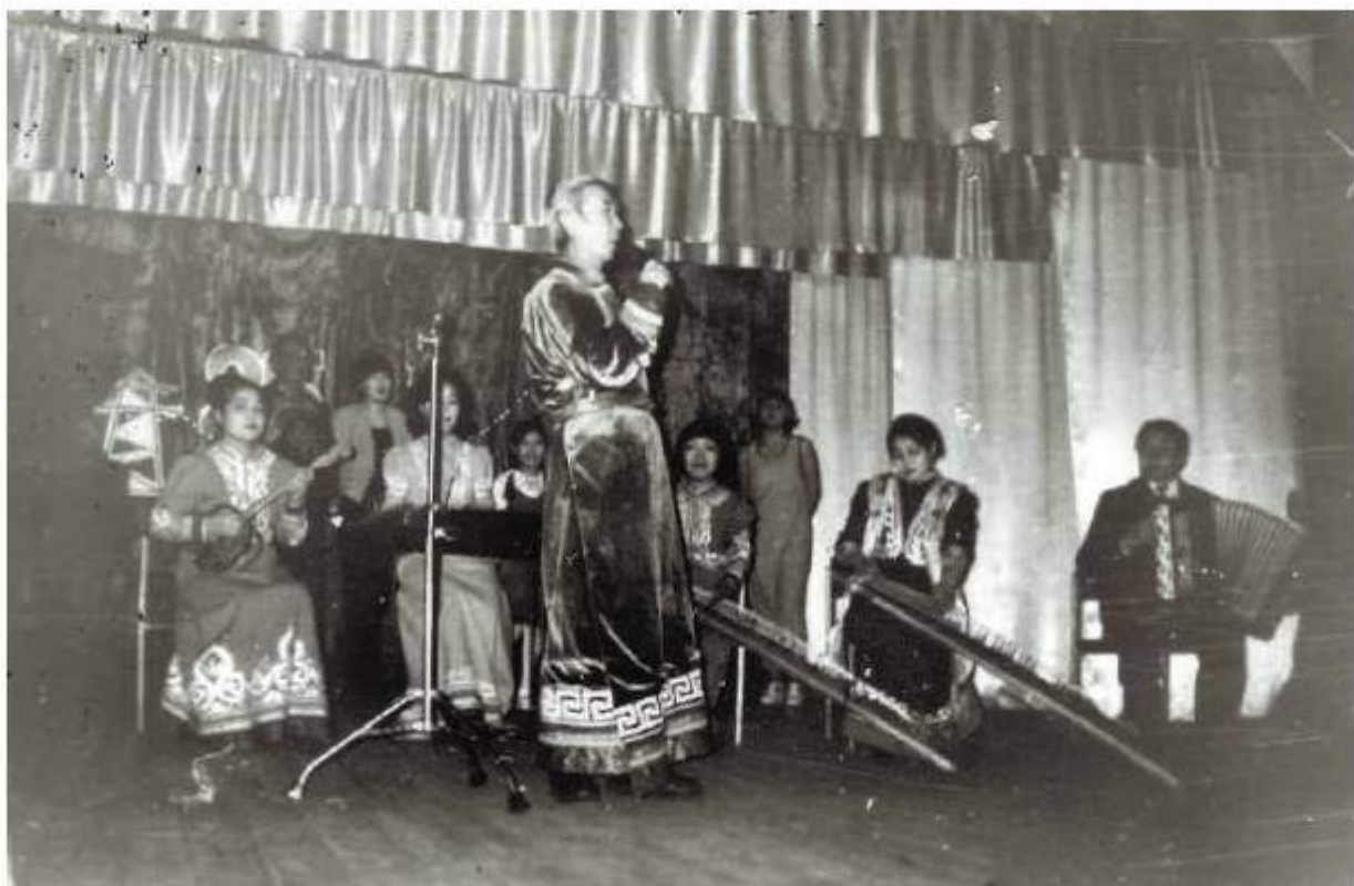
Оркестр Орликской музыкальной школы.