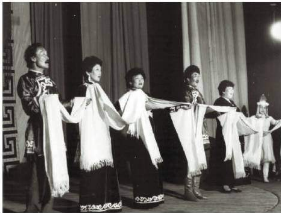
Дни экономики и культуры Окинского района, Тува, г. Кызыл, июнь 1990 г.