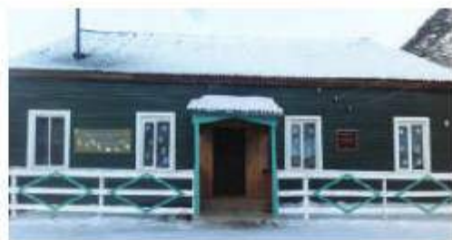
Балактинская сельская библиотека

Работа библиотекаря так же, как и работа учителя, связана с детьми, с разными категориями читателей. Формирование библиотечной политики, создание положительного имиджа способствуют тесному сотрудничеству библиотеки со школой, детским садом, родителями.