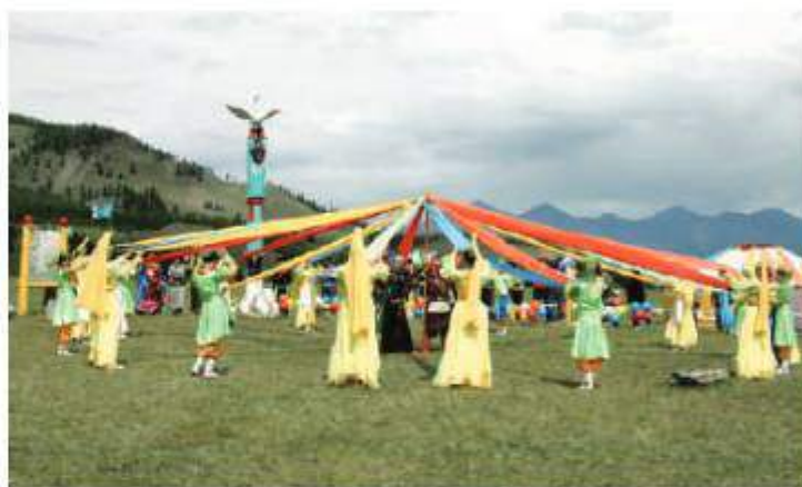
Межрегиональный праздник рода Хонгодоров, 2008 г.

На сегодня образцовый ансамбль состоит из трех групп участников: старшая, средняя и младшая. Младшая группа проходит обучение в классе общего эстетического образования Детской школы искусств, которая в дальнейшем входит в состав средней группы «Уулын суурьян».