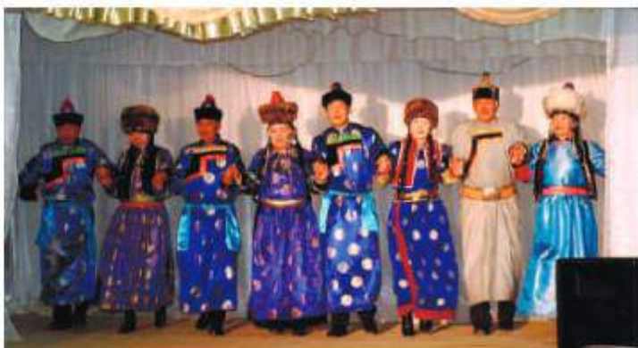
Еохор. Выездной концерт в село Хужир