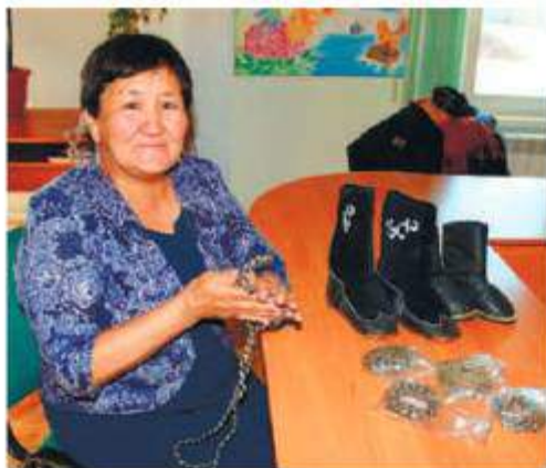
художников России «Жар-птица» (2007 г.), благодарностью Народного Хурала Республики Бурятия (2013 г.).