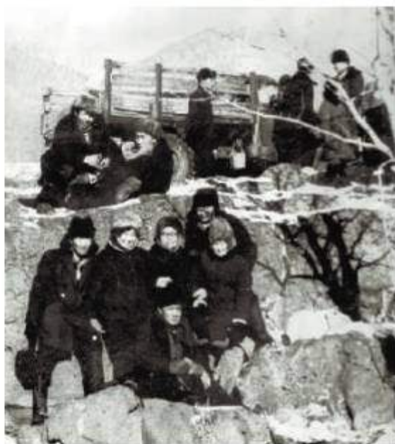
«Тангариз». Т.Ш. Пронтеева.