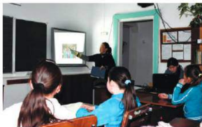
«Музей и дети»