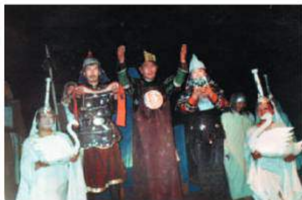
Спектакль по драматической поэме Е. Сындуева «Люди длинной воли», 2002 г.