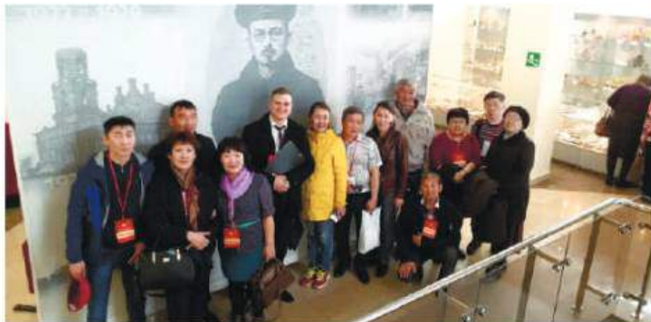
Орликский народный театр в Челябинске, май 2017 г.