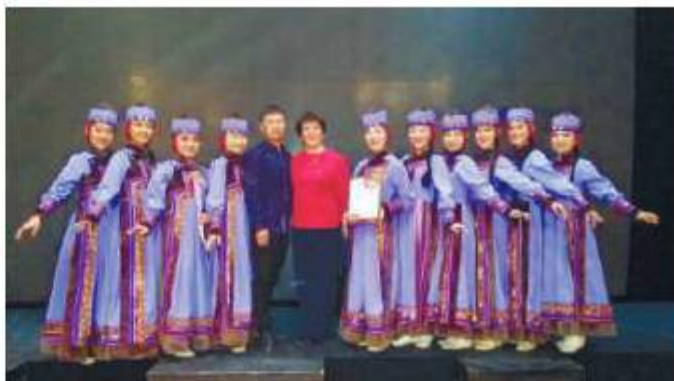
Образцовый хореографический ансамбль «Уулын-суурян»