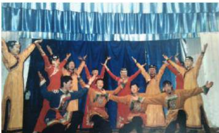
Фольклорный ансамбль «Монголжон»