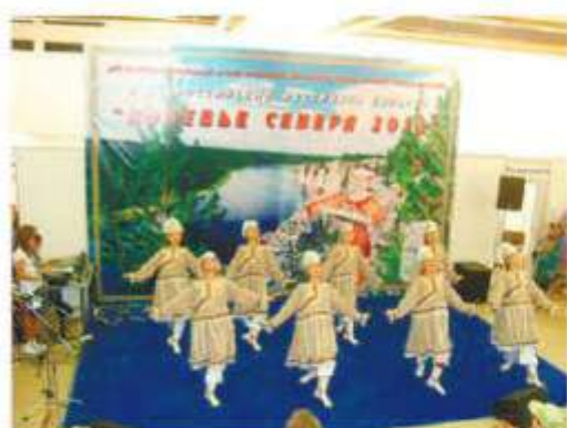
Кочевье Севера – 2011, Москва, «Уулын суурян»