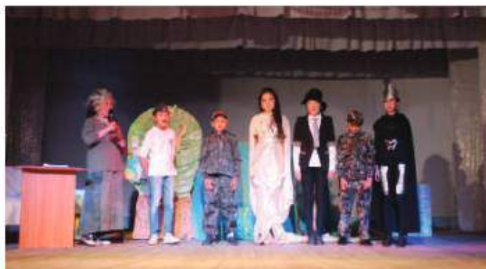
Пушкинский день России