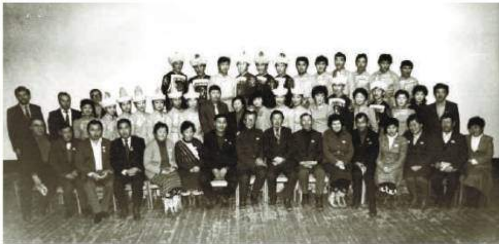
После концерта студенческого ансамбля БГПИ «Байкальские волны».