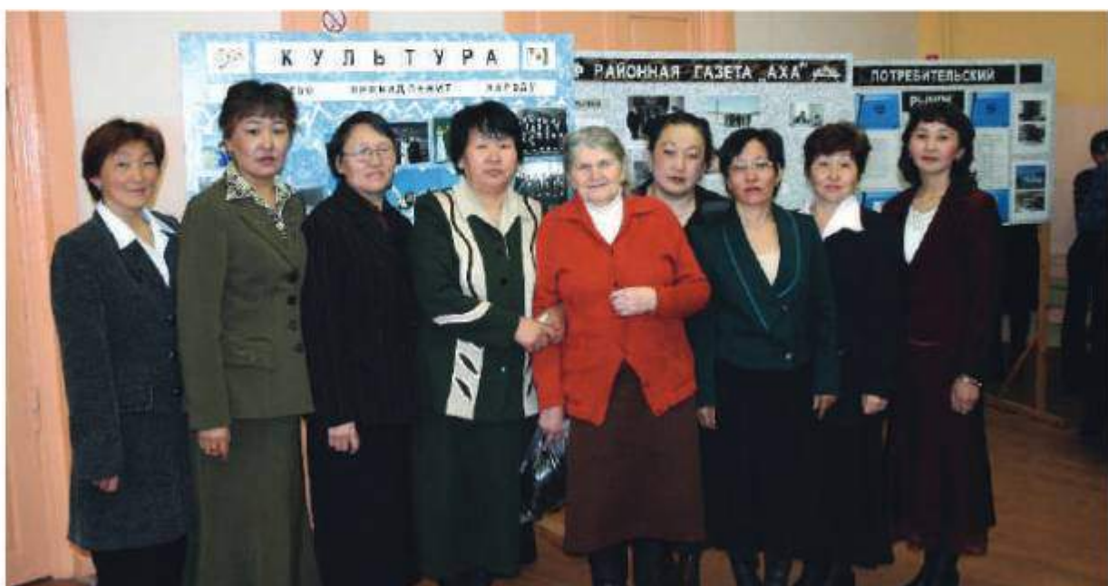
Итоговое совещание работников культуры, 2006 г.