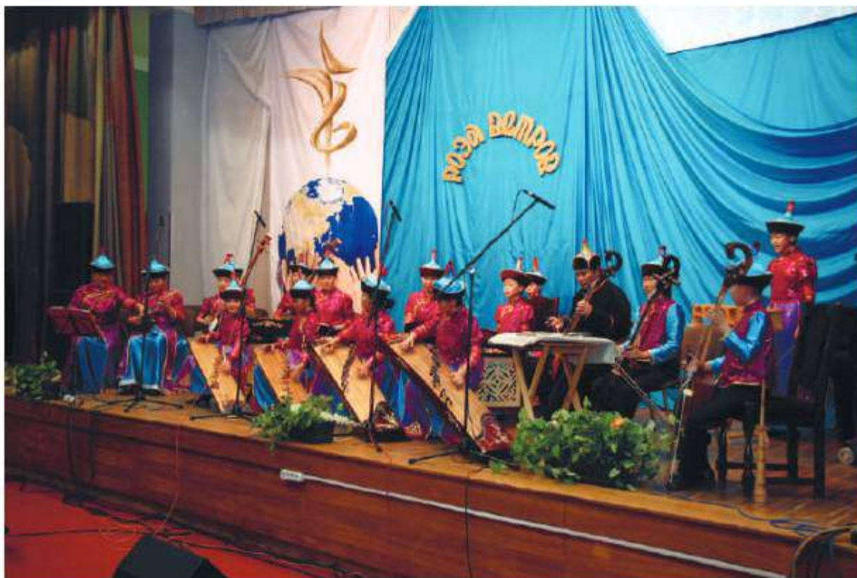
«Саран Туяа» в г. Москве, Роза ветров - 2008