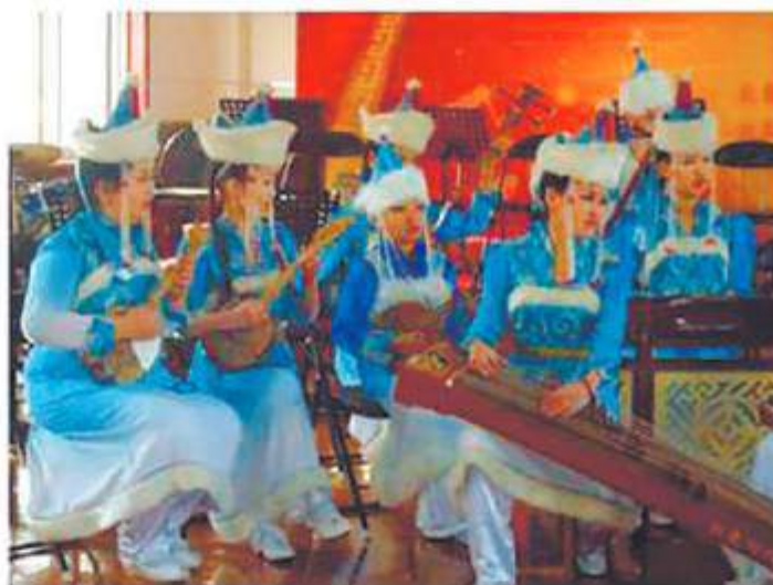
«Поющие сердца – 2011», Пекин, Ахынбаялиг

Дипломант 4-й степени IV (XIII) Международного конкурса