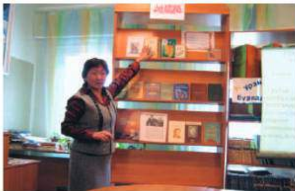
Дни бурятского языка