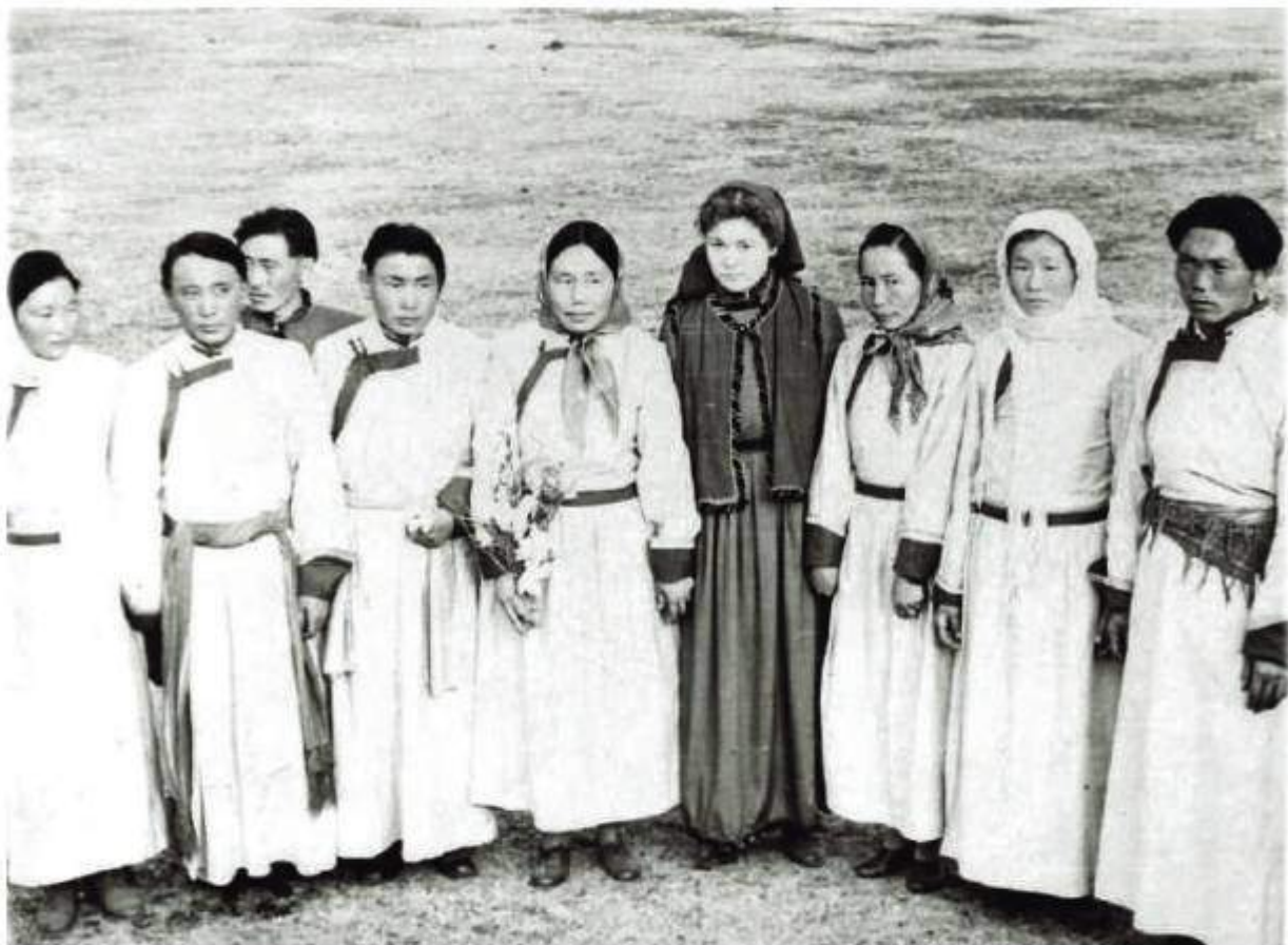
Хор при РДК, 1960-е годы