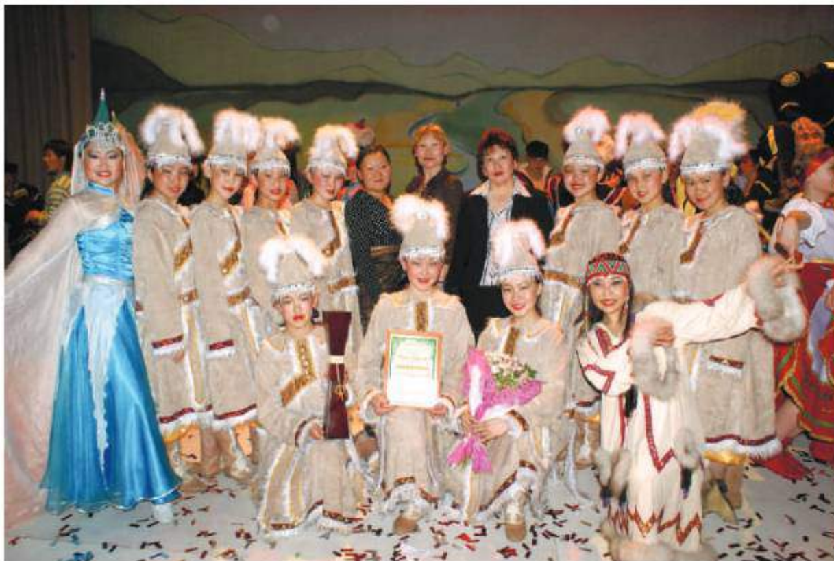
Межрегиональный конкурс народного танца «На земле Гэсэра – 2009». «Уулын-суурьян»