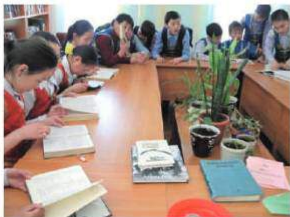
Библиографическая игра «По фронтовым дорогам»