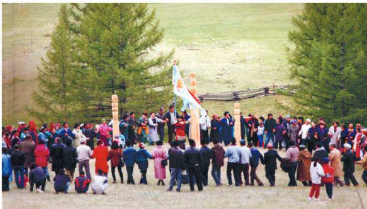
Открытие храма Гэсэра, 1995 г., с. Хужир

тие и укрепление учреждений культуры Окинского района.