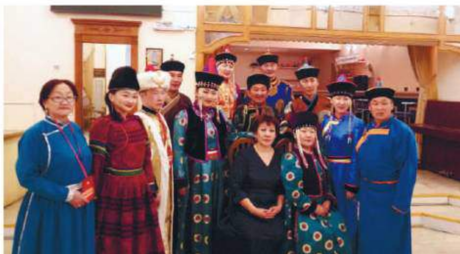
Орликский народный театр на Всероссийском конкурсе любительских театров «Две маски», май 2017 г.