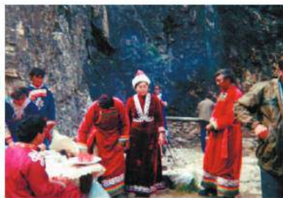
Встреча первых геологов Оки в Тэмэлике, начало 1990 г.