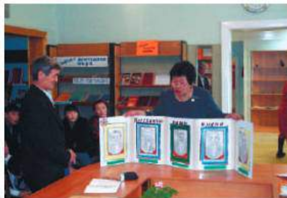
Тематический час «Восславлю ваши имена»