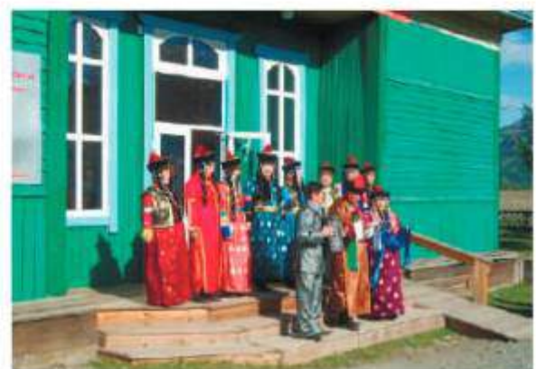
Встреча пенсионеров Бурятии