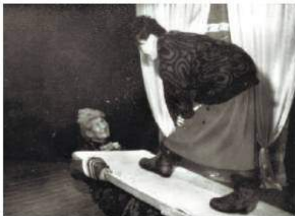
Спектакль «Пизанская башня»