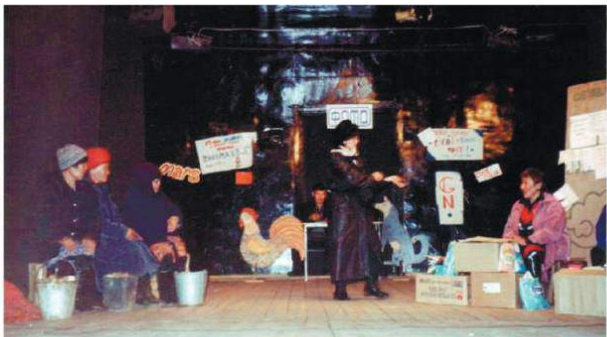
Спектакль «Ай даа, Бадмааха!», 1999 г.