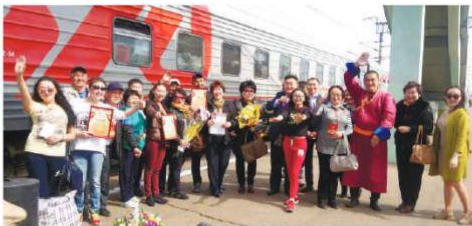
Встреча Орликовского народного театра из поездки в Челябинск, май 2017 г.