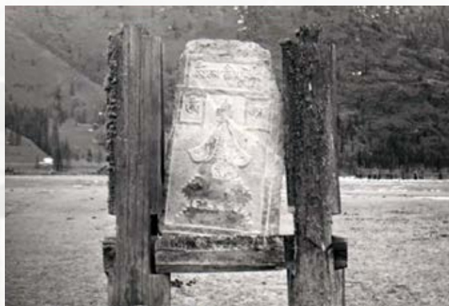
Каменная плита в Жэлгэне, где высечено слово «Субурган»

1 октября 1935 г. Окинский дацан официально закрыт, имущество передано хошунному исполкому «под культурные нужды».