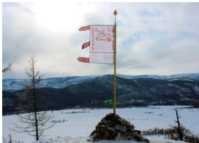
В 2016 г. в первый день «Сагаалгана» на священной горе Хан-Уула, был водружен всебурятский «Хии морин»

Хан-уула. Эта гора представляет собой горный массив мягких очертаний, выделяющихся среди островерхих, крутых саянских скал пологой округлой формой. Согласно легенде, под горой хранится огромный (8 метров длиной) меч Гэсэра. Некоторые даже свидетельствуют о том, что иногда меч светится и явственно виден сквозь толщу горы. Главное место поклонения – это обоо. В советское время ритуалы там не проводились, местное население совершали подношения на Эрын-губоо, отождествляя его с Хан-уула. Обоо расположено в седловине горы Хан-уула, кроме того, есть оно и у подножия этой горы, где также совершаются ритуалы почитания Хан-уула. Таким образом, Хан-уула почитается в трех местах: 1) обоо в седловине горы; 2) обоо у подножия горы; 3) жертвенник Эрын-губоо на подступах к горе Хан-уула. На обоо в седловине горного массива Хан-уула, у подножия высокой точки, сооружен маленький деревянный дуган (молельня). По свидетельству местных жителей, ранее здесь было несколько каменных обоо. В настоящее время вокруг нового дугана (2,5x2,0 м) установлено 13 каменных кладок высотой 0,2-0,3 м, на этих кладках поставлены фигурные листы от бороны, имитирующие котлы для удобства жертвоприношений. С северной стороны дугана находится сооружение треугольной формы из железных труб для прикрепления хий морин. Ниже по склону, перед дуганом, сооружены навес и скамьи, используемые во время массовых ритуалов на обоо. Вокруг дугана на деревьях привязаны ритуальные ленты – зурмадхан. Хан-уула считается святили-