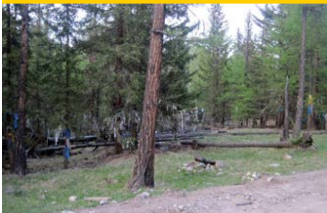
Жомбологэй мүргэл.

Бага Жомбологой нуур (водопад Малый Жомболог). Живописный водопад ниспадает в огромную воронку вулканического происхождения, внизу река Жомболог. У водопада, на северо-восточной стороне у края воронки установлена деревянная беседка с 5-скатной крышей. Напротив, на северной стороне видна гора Улаан-хайрхан, вдали на юговостоке различим Торог-шулуун.