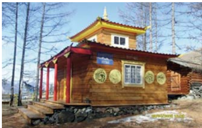
Дуган «Ламажабдоллинг». Построен в 2003г.

Белая и Зеленая Тары, словно две сестры на обеих сторонах горной Оки, оберегают людей, живущих на Окинской земле.