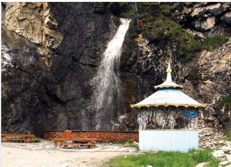
Священное место «Тэмэлик» – ритуал приветствия и поклонения в священном месте

скалу на высоте 3-4 м над вертикальной площадкой с большим, около 2 м в диаметре, сквозным отверстием, под которым находится небольшой грот. В настоящее время культ хозяина перевала сохранился, но его основное святилище перенесено вниз к водопаду Тэмэлиг.